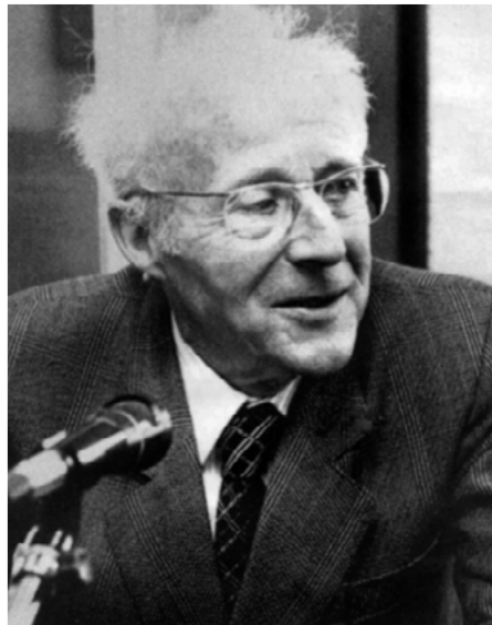
Quelle: Raymond Oberlé: Mulhouse ou la genèse d'une ville , Editions du Rhin, 1985

Eine französische Übersetzung des Vertrags von 1515 findet sich auf http://traite-mulhouse-1515.heinijuraschek.com